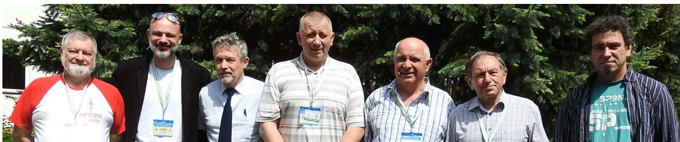
Od lewej: SP7CBG, SQ8MXS, SP5UAR (zastępca), HF1D, SP2X, SP6CIK, SP9NJ (zastępca)