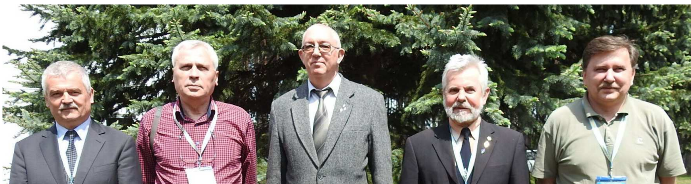
Od lewej: SP2JLR, SP9HQJ, 3Z6AEF, SP2JMR, SP5LS